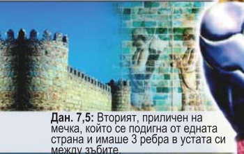
Дан. 7,5: Вторият, приличен на мечка, който се подигна от едната страна и имаше 3 ребра в устата си между зъбите.